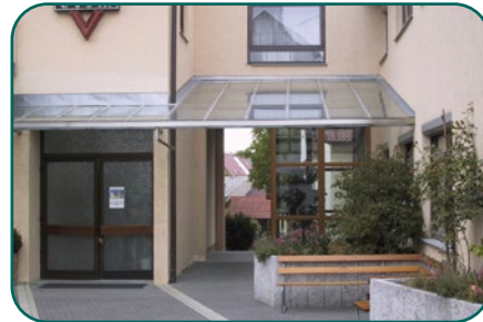
vor dem Umbau

Ein kleiner Schritt mit großer Wirkung – wir freuen uns riesig über diesen Fortschritt!