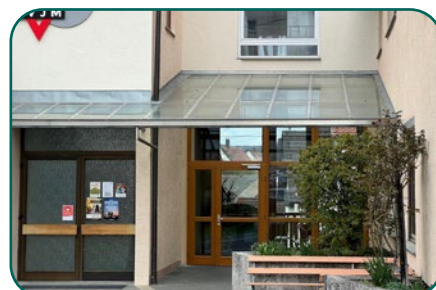
2025 nach dem Umbau

Ein kleiner Schritt mit großer Wirkung – wir freuen uns riesig über diesen Fortschritt!